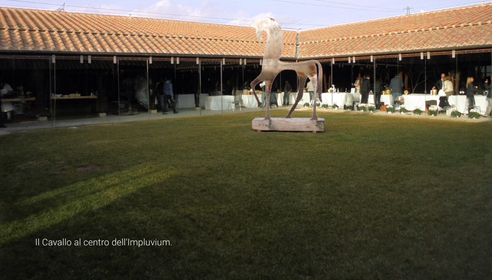
Il Cavallo al centro dell'Impluvium.

attiva sia nel supportare la cultura sia l'arte in genere. Eleonora investì molto anche nelle proprietà, acquisendo a Firenze il magnifico Palazzo Pitti, e, sulla Costa Toscana, vaste tenute agricole nella Maremma pisana e livornese, oltreché i feudi di Castiglione della Pescaia e Isola del Giglio. Non solo acquisizioni allo scopo di consolidare il patrimonio, ma per mettere in piedi una capillare ed efficiente organizzazione di supporto agroalimentare per la città di Firenze, molto utile, per esempio, nel caso di carestia.