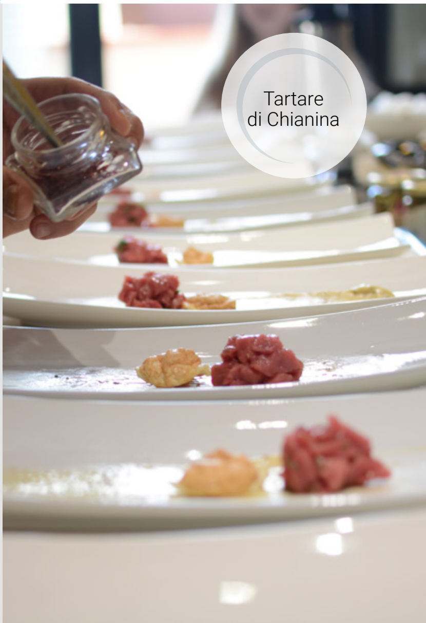
Tartare di Chianina