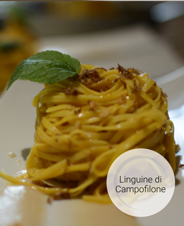
Linguine di Campofilone

è anche legata all'origine del tartufo dal momento che la pianta madre esercita una certa influenza che ne determina alcune caratteristiche.